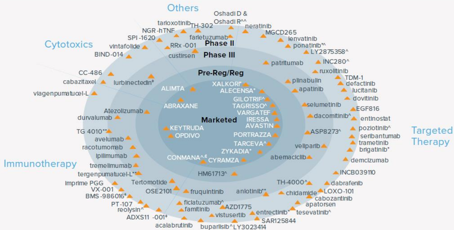
Chart 4: Key In-Market and Investigational Agents for NSCLC